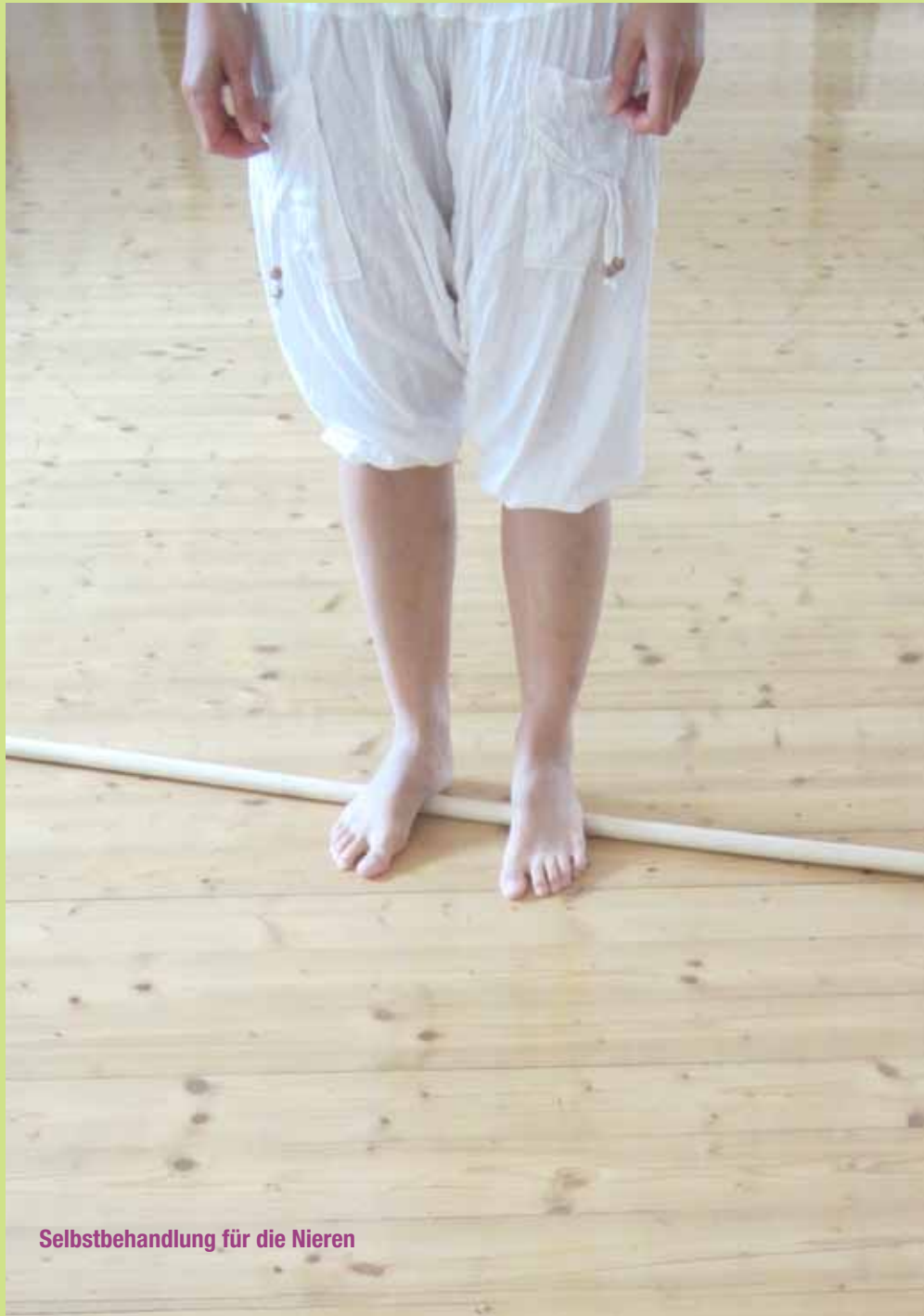
Selbstbehandlung für die Nieren

Der Magen zeigt, wie Anfangs erwähnt, unseren Appetit auf das Leben. Schleimbildende Nahrung und Zucker verursachen Schlacken die unsere Körperbahnen verstopfen!